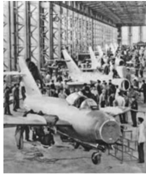
中国制造的第一批喷气式歼击机