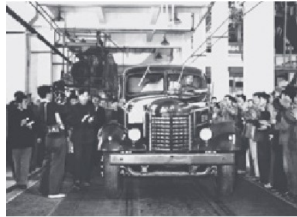
第一辆解放牌汽车驶下装配线