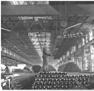
第一个五年计划期间，鞍山钢铁公司兴建的第一座大型轧钢厂