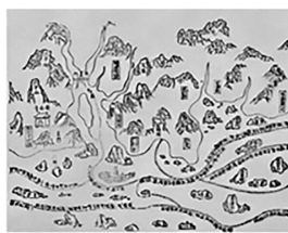
④明朝《郑和航海图》(局部)