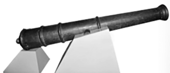
①清朝神威无敌大将军铜炮

27. (18分)研究历史材料是我们了解历史的重要方式。为此,七年级某班同学们收集了很多史料,请你帮助他们完成史料整理。