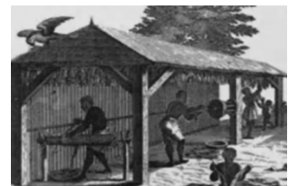
18世纪黑奴加工烟草的版画