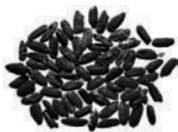
浙江义乌桥头遗址 出土的炭化稻粒